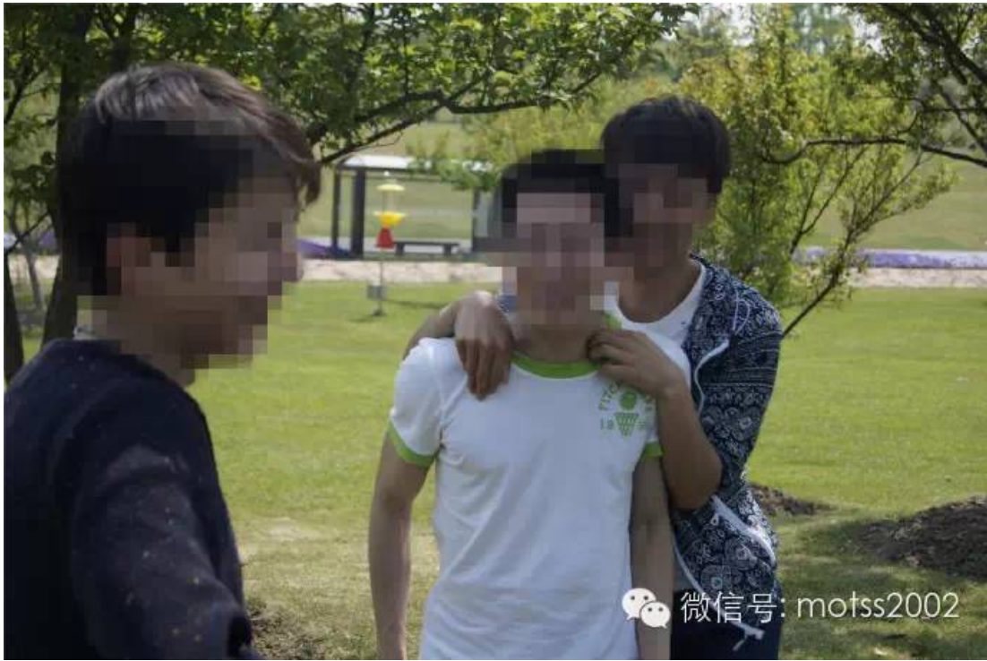
Cao泥马和深情款款地偷拍它屁股的Cao植童鞋