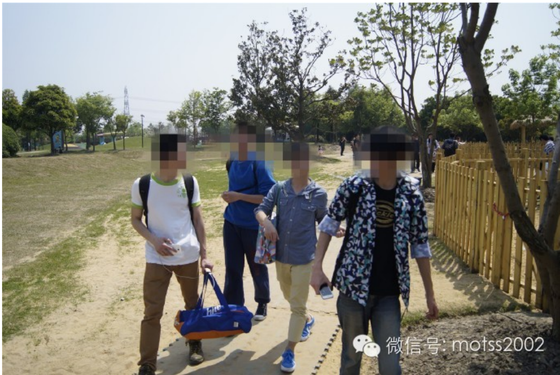
找到同类的基佬们