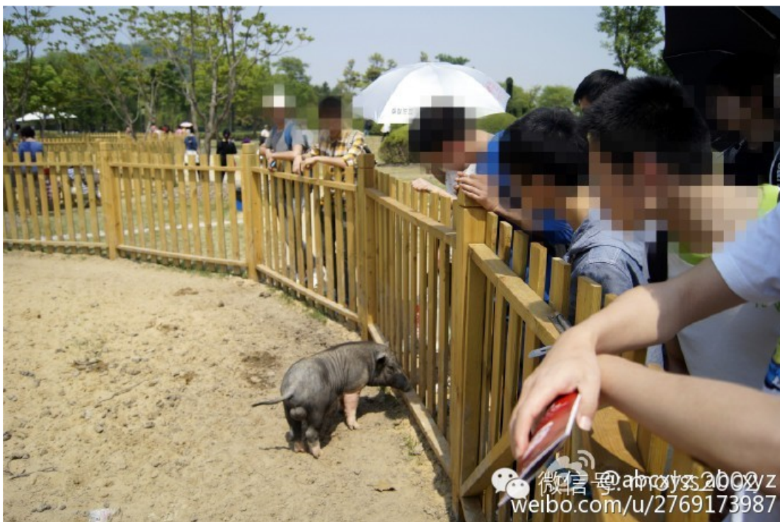
ABC was flattered when the Grass Mud Horse blinking at him, instead of showing its butt.