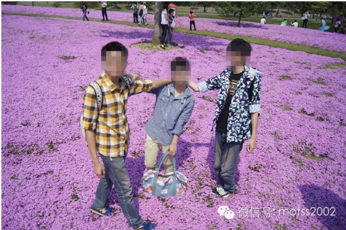
本来想拍千手观音的...