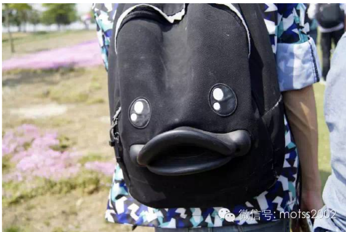
挎着站长挎包的充满违和感与少女心的abcxyz, 如果这张皂片被和谐了你们要指控他公器私用!