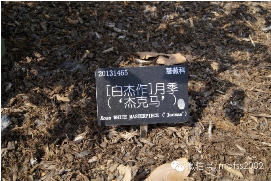
终于走到了植物园温室