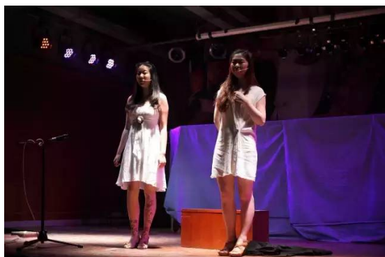
猫猫和双双 讲述【短裙】的故事