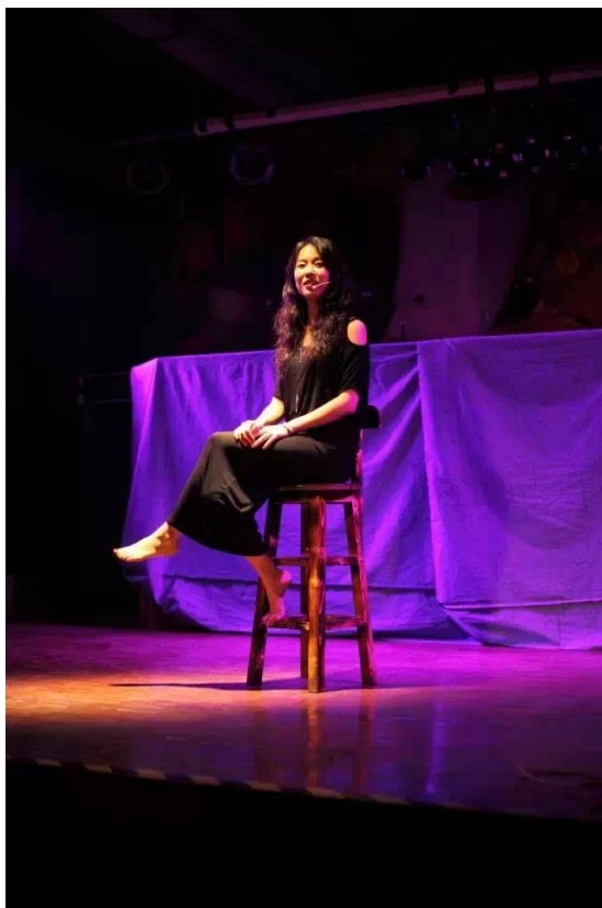
言姐姐在讲述 【双性恋】阴道独白