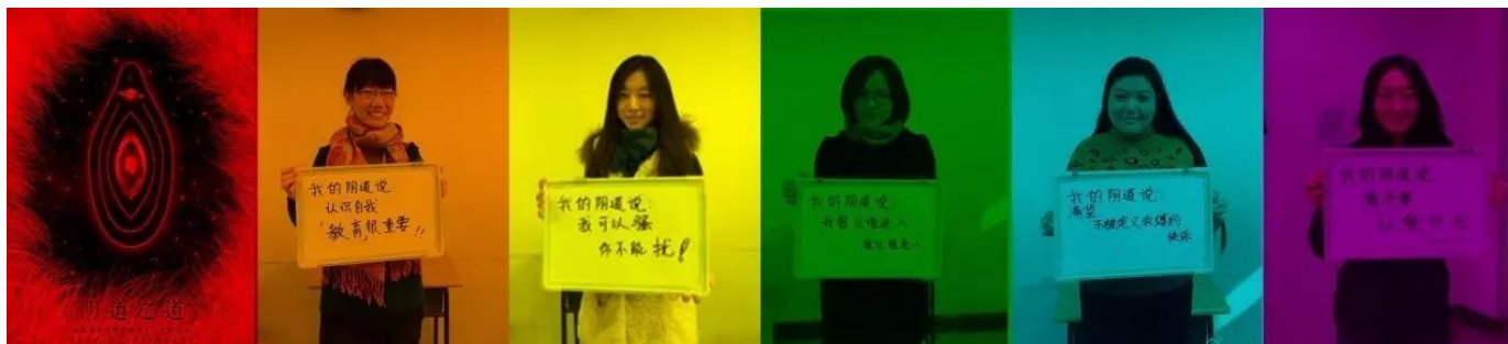
· 北外性别小组相册图集

“我们的剧组，从今年9月开始筹备自己的《阴道之道》，我们回忆、思考、自省、实践。我们说出阴道，讲述阴道，是为了发掘身体的力量，也发掘心灵的力量。我们已经不像我们的先行者那样，担心列位会怎么听，怎么理解，怎么谈论阴道背后蕴含的丰富命题，或担心猎奇的目光和武断傲慢的声浪。因为我们深知，唯有我们不再担心，我的阴道，我们的阴道，才能真正被说出，被理解，被正视。——《阴道之道》全剧组”