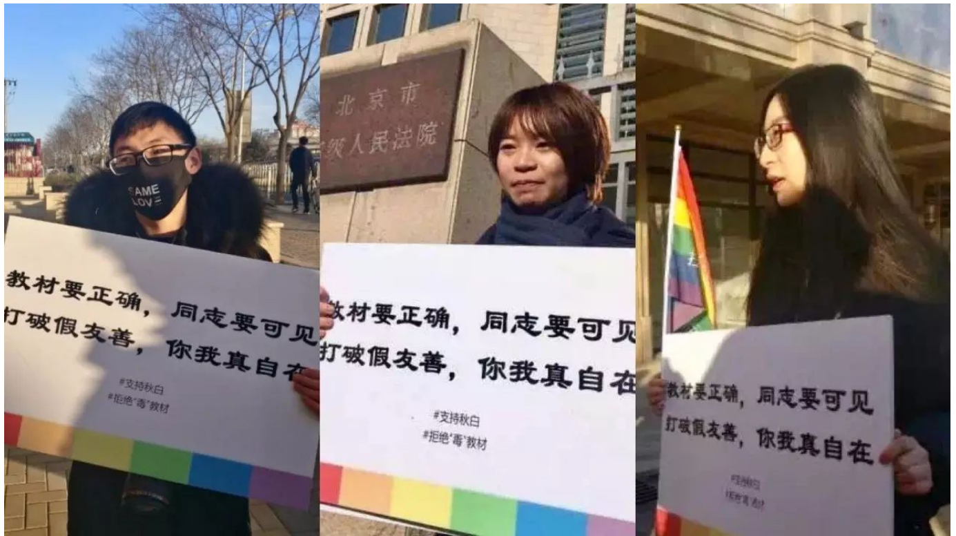
·秋白状告教育部二审

稻子 ：啊我想起来，就是我也接触过这样的人，TA们身为性少数，却认为发声和平权行为没有必要，反而觉得“太跳了，给性少数群体抹黑”。