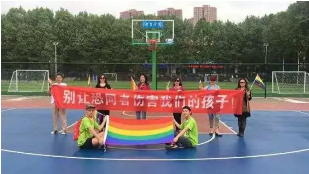
同志妈妈们自发组织小分队，来到事发地，力挺同志子女

现在 向阳花开 协同姐妹组织 酷儿论坛 号召小伙伴们（特别是女同志们）一起参与到这一反歧视的倡导活动中来，如果你不是女同志也没关系，我们还有假发，1秒钟变身跨拉拉。