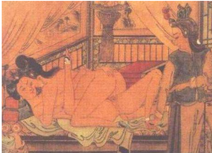
“龙阳”、“磨镜”表示不服

随后针对华科女篮恐同的事件，全国各地的小伙伴们（当然也有老伙们，就是亲爱的同志家长啦）发起了一场运动，叫：拉拉占领篮球场。