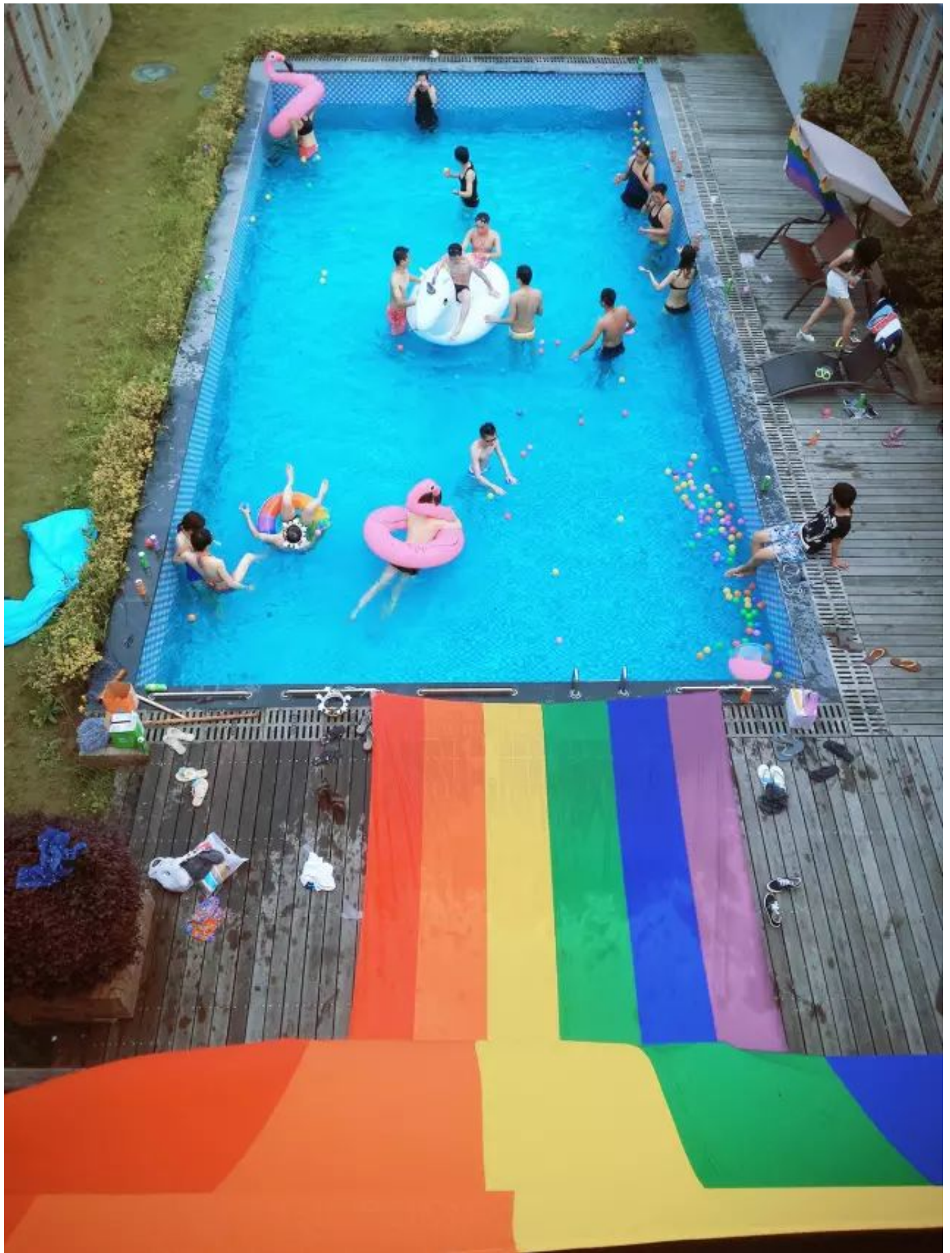
▲ 去年“有泳气”泳池趴活动照

今年向阳花开第二届“有泳气”泳池趴的主题就是 “打破身材焦虑，大胆秀出泳气” 吉祥物也从