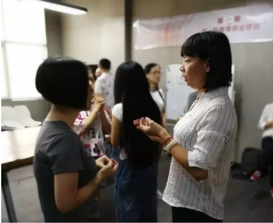
（图：性别故事分享，相见恨晚的老师们）

如有老师分享自己曾因出生是女性而差点被送走，有老师因自己的外表、气质等不够像标准的“男女”而遭到嘲笑，也有老师分享自己遇到自杀倾向的同志学生前来咨询。而这些事件也把TA们带到了这个培训。