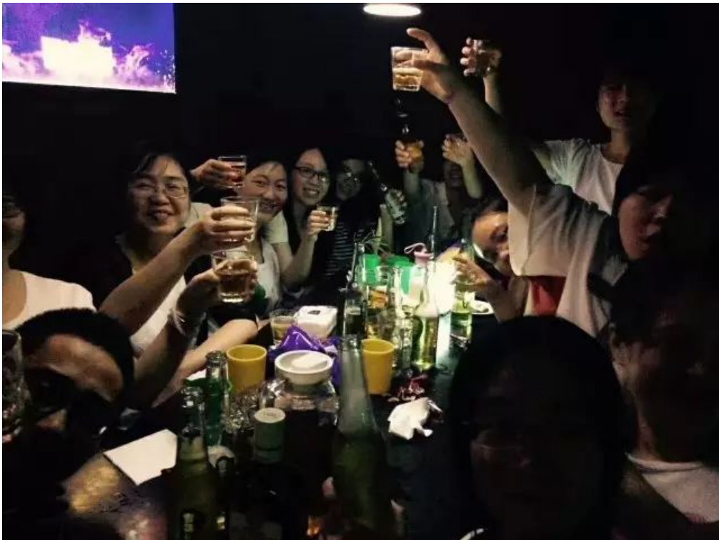
（图：为我们的友谊干杯！）