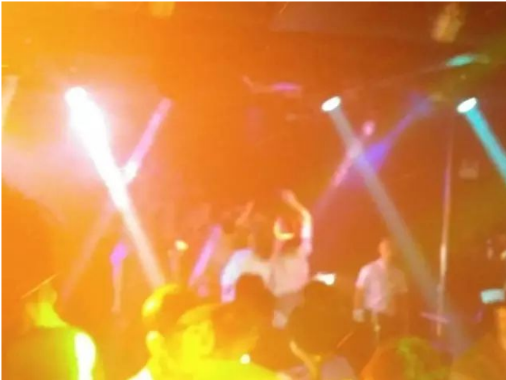
(图：老师们跃身Gay吧舞池！某老师说：“那一刻，我是少数！”)