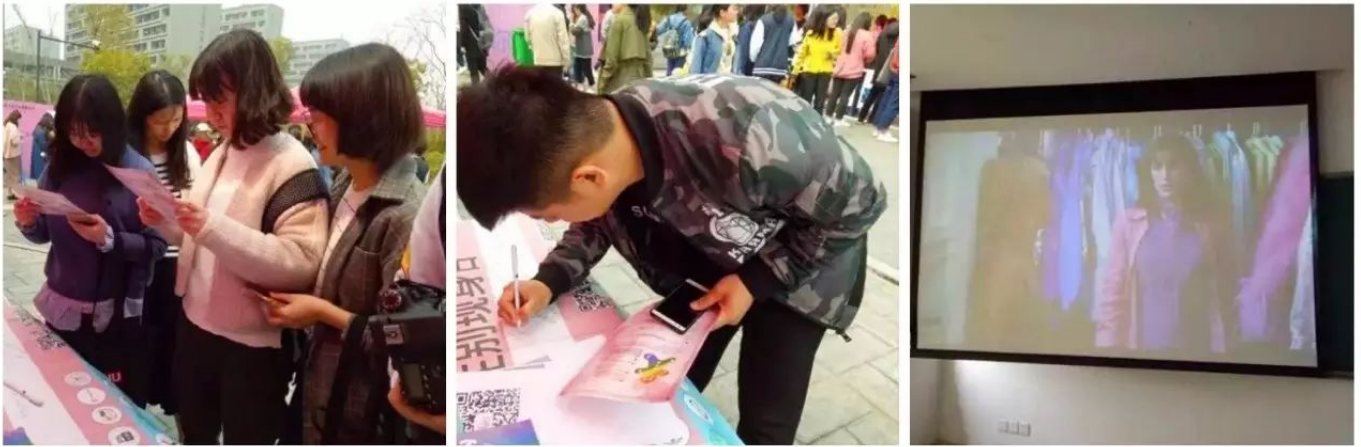
·精心布置了场地并征集了大家的支持签名