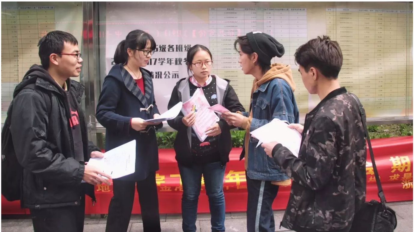
·向同学们发放资料并介绍跨性别知识

二、2017.4.9正值浙大120周年校庆之际的集体婚礼，搞事小分队当然不能错过这一波蹭热点的机会。在祝福这些新人们的同时，我们也在展望，什么时候浙大的集体婚礼也能有我们的一席之地，什么时候浙大的集体婚礼也能接受同性伴侣，甚至是多元成家伴侣的报名申请呢？