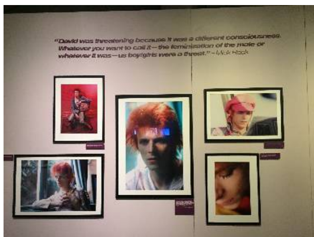
·流行文化中的性别演绎