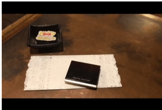
使用产品：KEVYN AUCOIN双色修容膏 色号：#4

将粉底和遮瑕推匀后，要进行这个妆容最最最最最重要的部分，那就是——修容啦！首先将深色的修容膏上在需要打阴影的部位，浅色的上在需要提亮的部位（同时还可以遮盖一下眼下的黑眼圈和泪沟）。