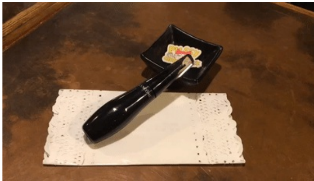
使用产品：LANCOME天鹅颈睫毛膏 色号：01