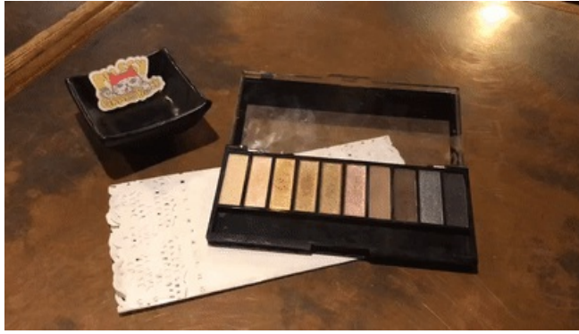
使用产品：WetNWild十色眼影盘 色号：P753A

然后用之前晕染眼尾的刷子，不用粘粉，对眼中的打亮进行一下过渡晕染，用上眼窝色的刷子对整个眼妆的边缘再进行一下晕染。最后画上眼线、戴上假睫毛、涂上睫毛膏这个眼妆就完成啦。