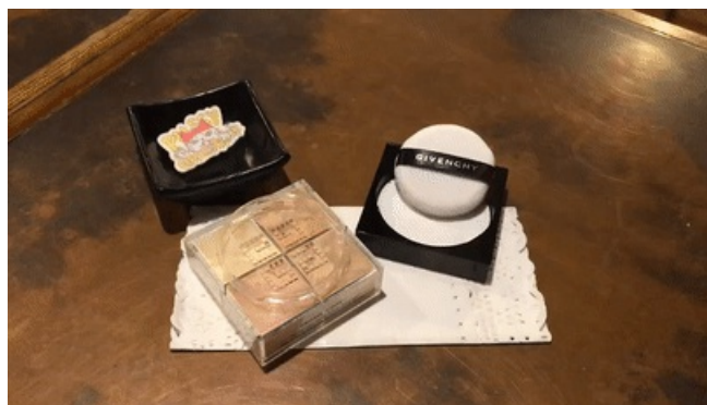
使用产品：GIVENCHY 四色散粉 色号：#2

修容完成之后，在眼下和两颊需要提亮的位置进行烘焙定妆，同时这也可以使修容的界线更明确。