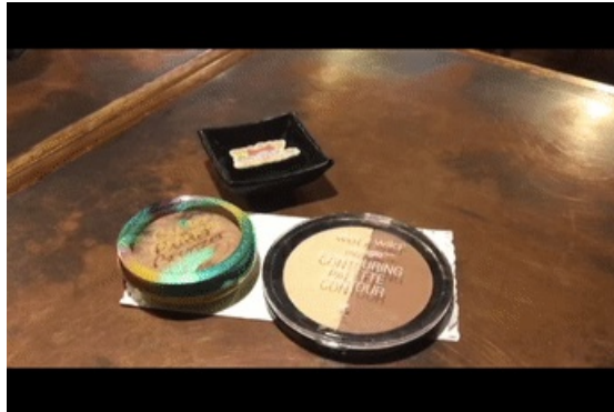
使用产品：WetNWild 双色修容盘 色号：P7491 PhysiciansFormula 黄油古铜粉 色号：LightBronzer

修容膏的效果偏自然，所以还需要粉状的修容和古铜粉做进一步的加强，尤其是太阳穴、两颊和下颌线的位置。