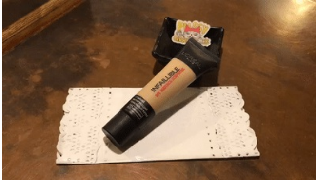
使用产品：L'OREAL INFAILLIBLE 24h哑光粉底（俄版）色号：5号