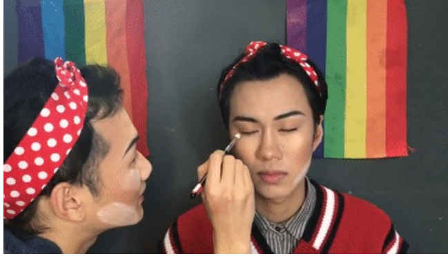
用一个金色的亮片色进行眼中打亮。