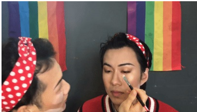
用一个白色的珠光色对眼头打亮。