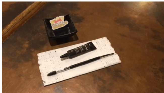
使用产品：NYX眉胶 色号：Black

从图片中可以看出，铆钉工的眉毛是非常欧美的挑眉，这也是本次妆容的重点之一。因此我们在上底妆之前，先修好了眉毛，用眉胶画出了眉形后再用遮瑕膏修饰眉毛边缘，让它看起来更干净，同时也起到了提亮眉骨的作用。