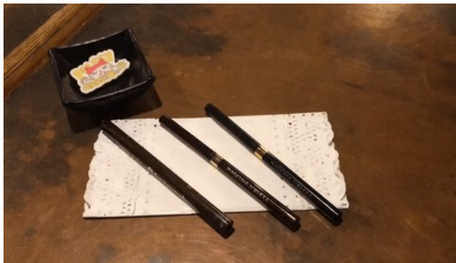
使用产品：PhysiciansFormula三色眼线胶笔 色号：WarmNudeEyes KissMe眼线液笔 色号：棕色

然后用之前晕染眼尾的刷子，不用粘粉，对眼中的打亮进行一下过渡晕染，用上眼窝色的刷子对整个眼妆的边缘再进行一下晕染。最后画上眼线、戴上假睫毛、涂上睫毛膏这个眼妆就完成啦。