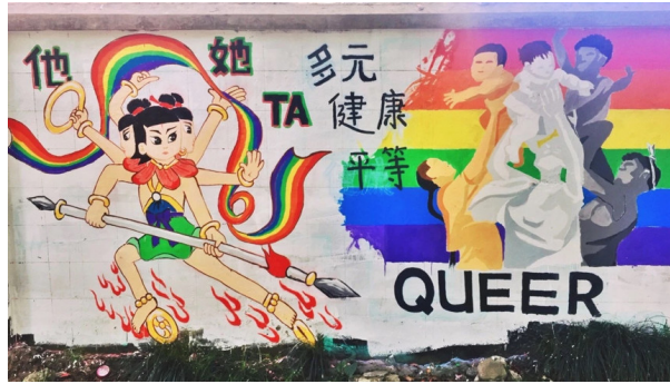
骄傲月的“酷儿小哪吒”和“亚非拉妇女多元成家”涂鸦