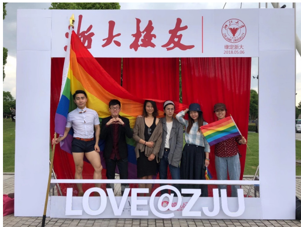
集体婚礼现场倡导