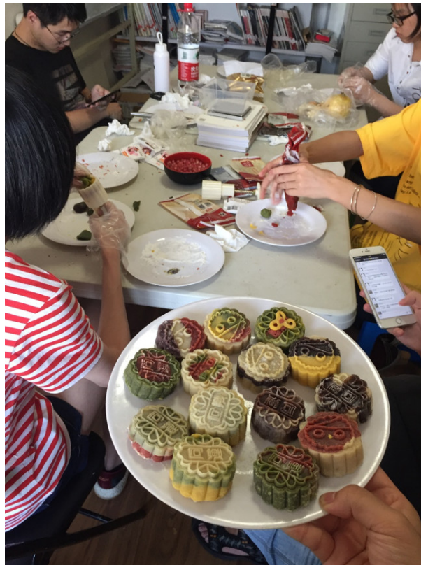
中秋节小伙伴一起制作可爱月饼