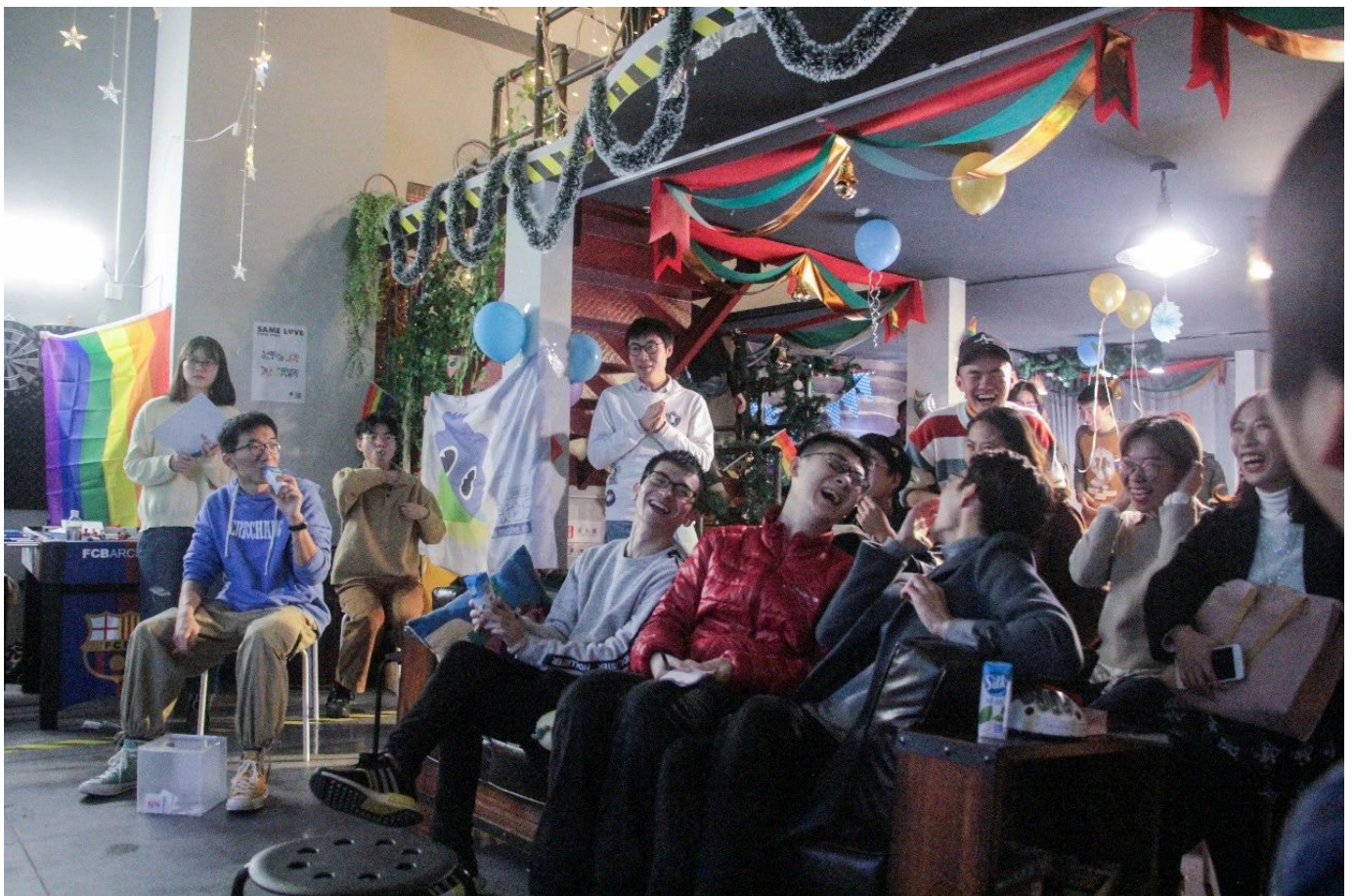
图/2018年“回家”新年筹款派对