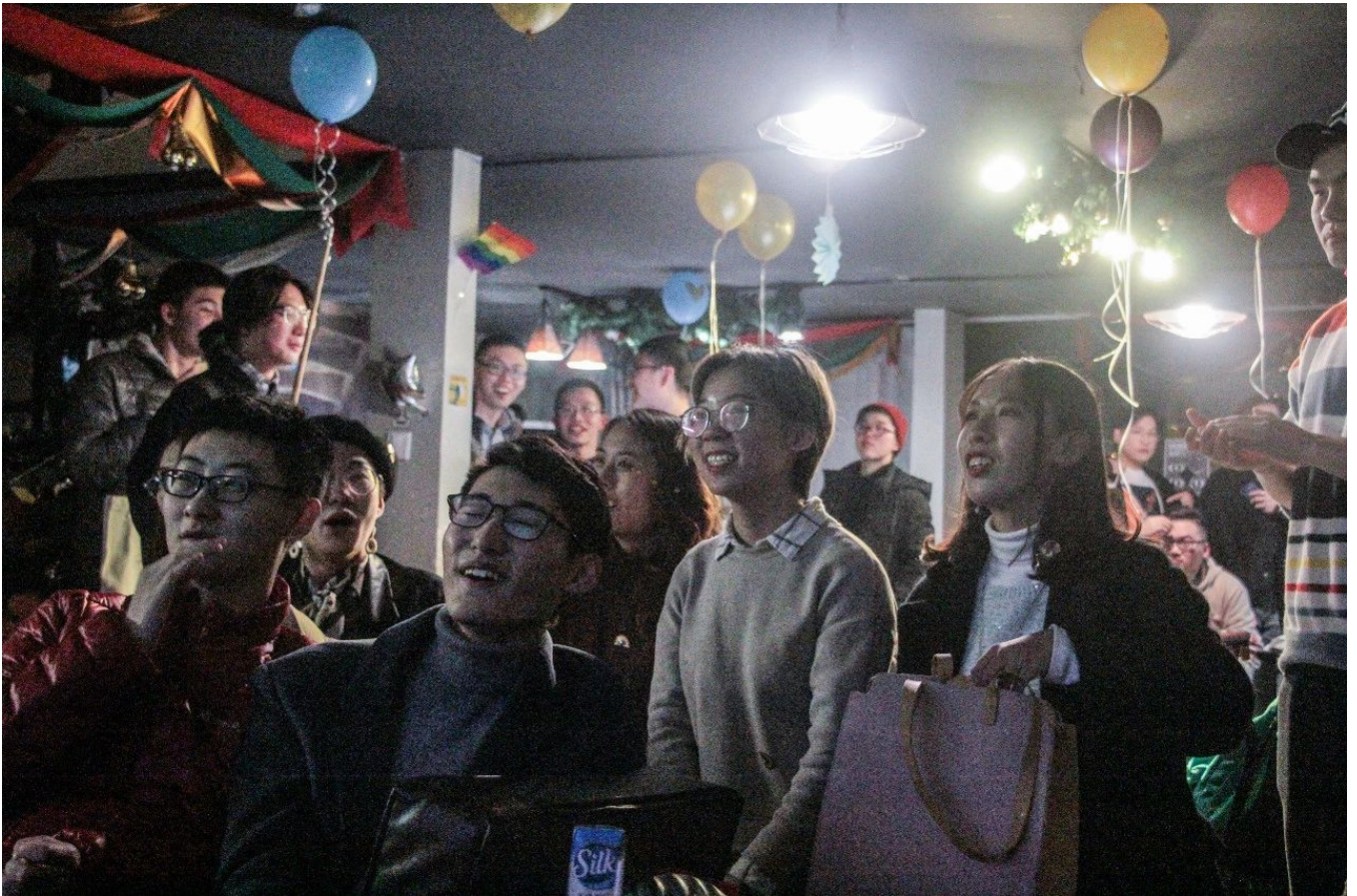
图/2018年“回家”新年筹款派对