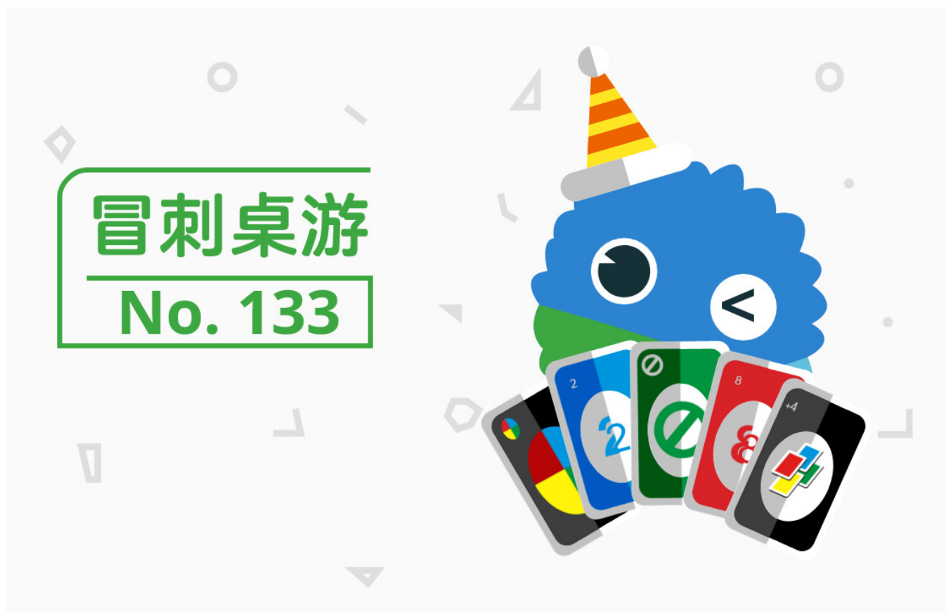
图/冒刺桌游宣传海报