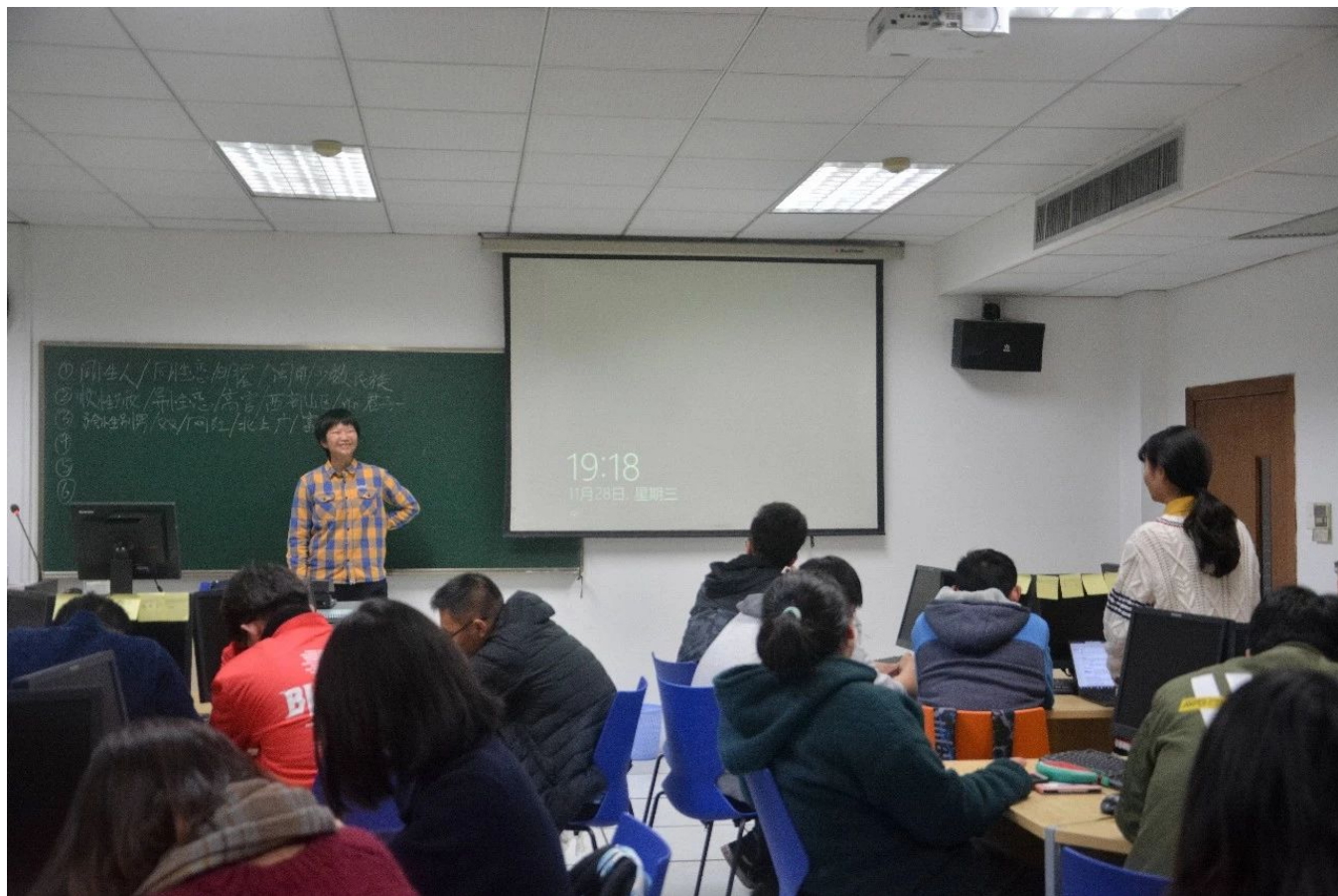
图/性别工作坊进浙大