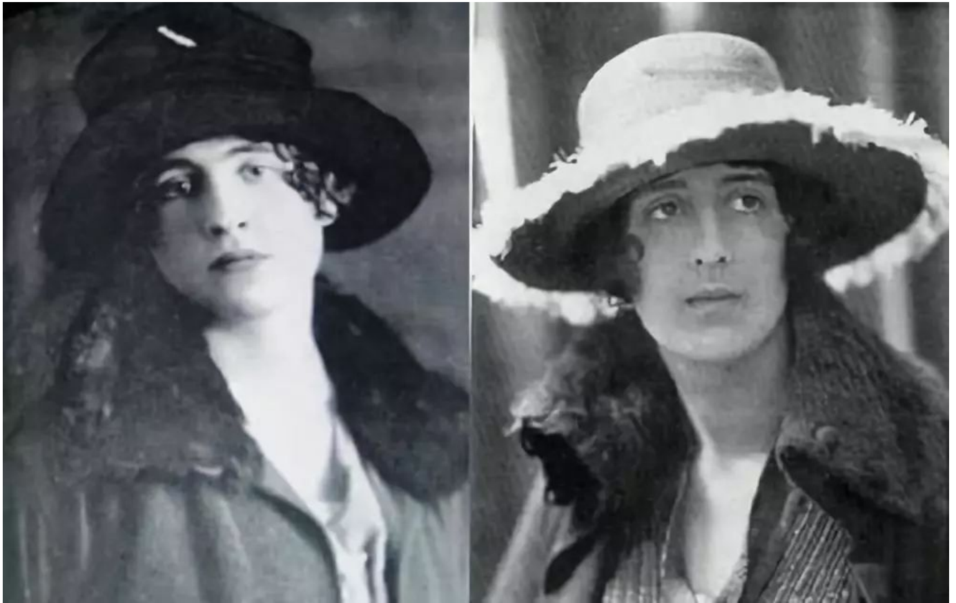
[Vita & Violet]

Vita情感奔放，有过许多风流韵事。在Virginia之前，与小说家维奥莱特·特莱弗斯（Violet Trefusis）的同性关系在她的私人生活中留下了最深最持久的影响。Vita和Violet合著了一本小说《挑战》，小说中男主角Julia就是Vita化身男性时使用的绰号。但Vita的母亲，萨克维尔女士，发现描绘太明显，于是反对英国的出版社出版这本小说。