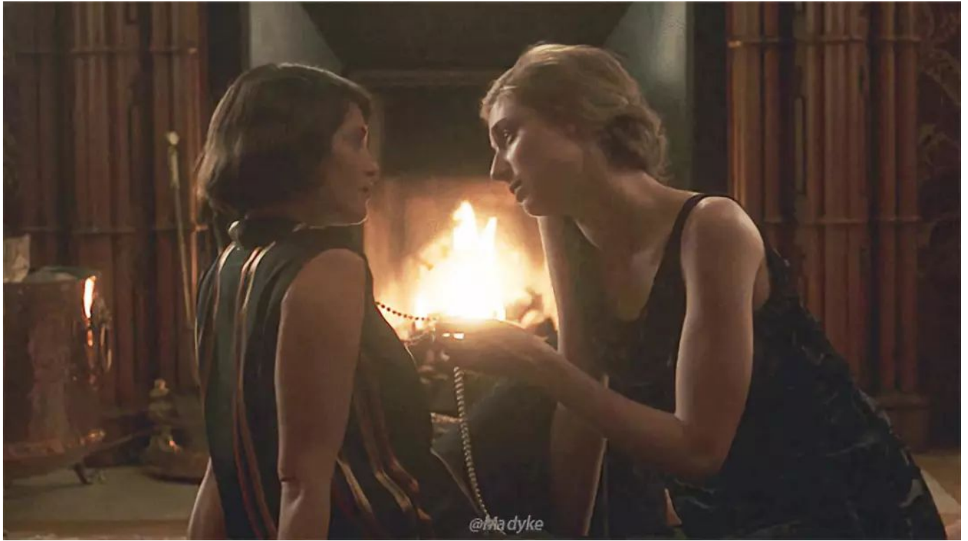
[Vita & Virginia]

弗吉尼亚·伍尔夫（Virginia Woolf）是世界上最著名的作家之一，是文学现代主义和女权主义的先驱。在1920年代，她与身为贵族且为当时的畅销书作家维塔·萨克维尔·韦斯特（Vita Sackville-West）在文化沙龙活动Bloomsbury中相遇。直率热情的Vita钦羡Virginia的才华，尝试着不断接近、挑逗Virginia。忧郁敏感的Virginia最终突破了自己一直存在障碍且压抑的心理，与Vita开启了一段长达10年的恋情，并维持着性关系，互通了很多情书和日记。Virginia也在这段时间创作出了许多伟大的文学杰作——《到灯塔去》、《海浪》以及以Vita为原型后被翻拍成电影的关于性别转换的小说《奥兰多》。