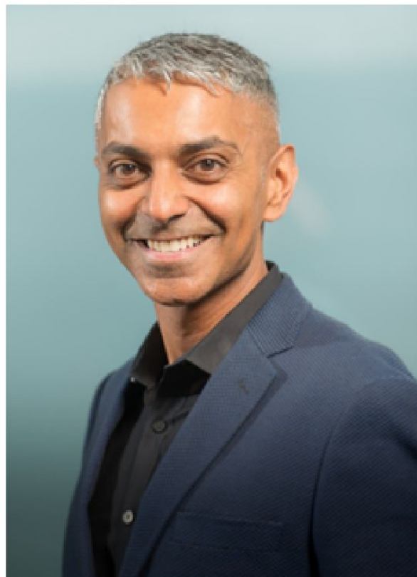
作者 Amin Ghaziani