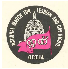
[1979年华盛顿男女同性恋大游行]

对于那些对美国现代男女同性恋历史感兴趣的读者，Ghaziani以展示大游行历史的形式提供了新的实证材料，并追溯了如下问题：对于那些抵抗文化来说，与组织任务紧密相关的内部分歧是如何产生实质性的益处？