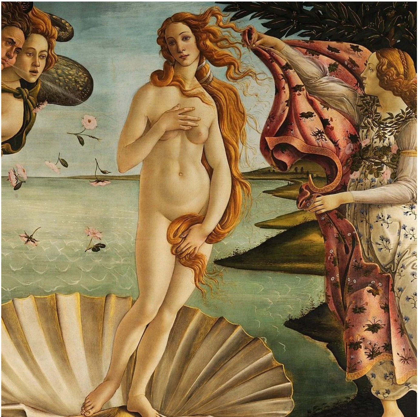
Detail of the Birth of Venus by Botticelli