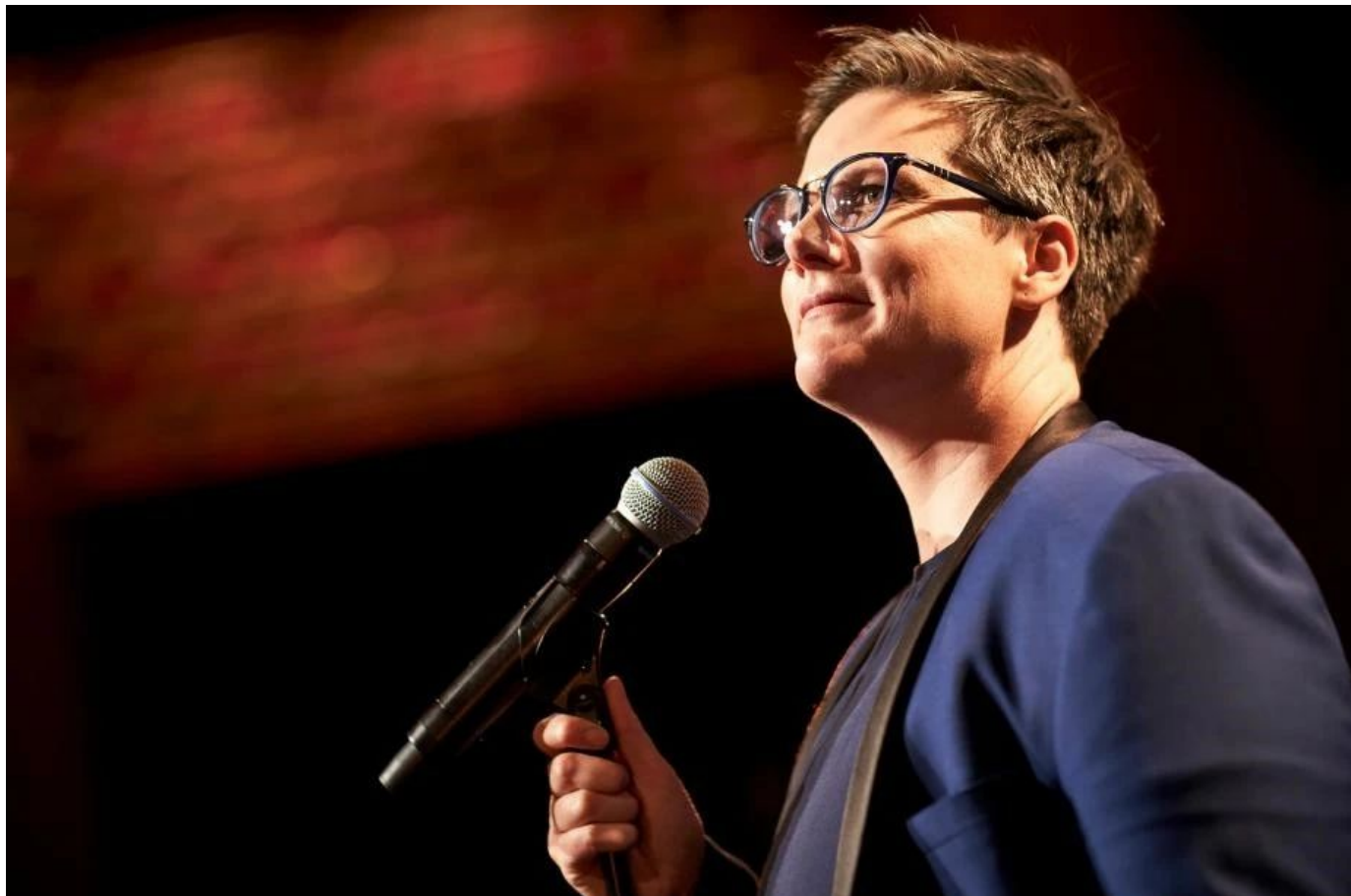
图 | Hannah Gadsby 近照